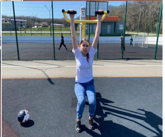
Подвижные игры на свежем воздухе